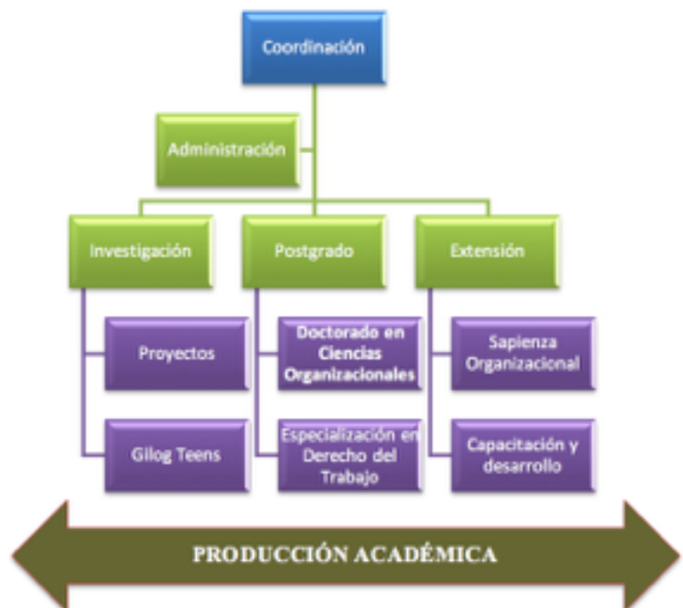
Organigrama del Grupo de Investigación Legislación Organizacional y Gerencia (GILOG)

El Grupo de Investigación presenta su organigrama estructural, denotando el interés por la docencia, investigación y extensión como dinámica de trabajo.